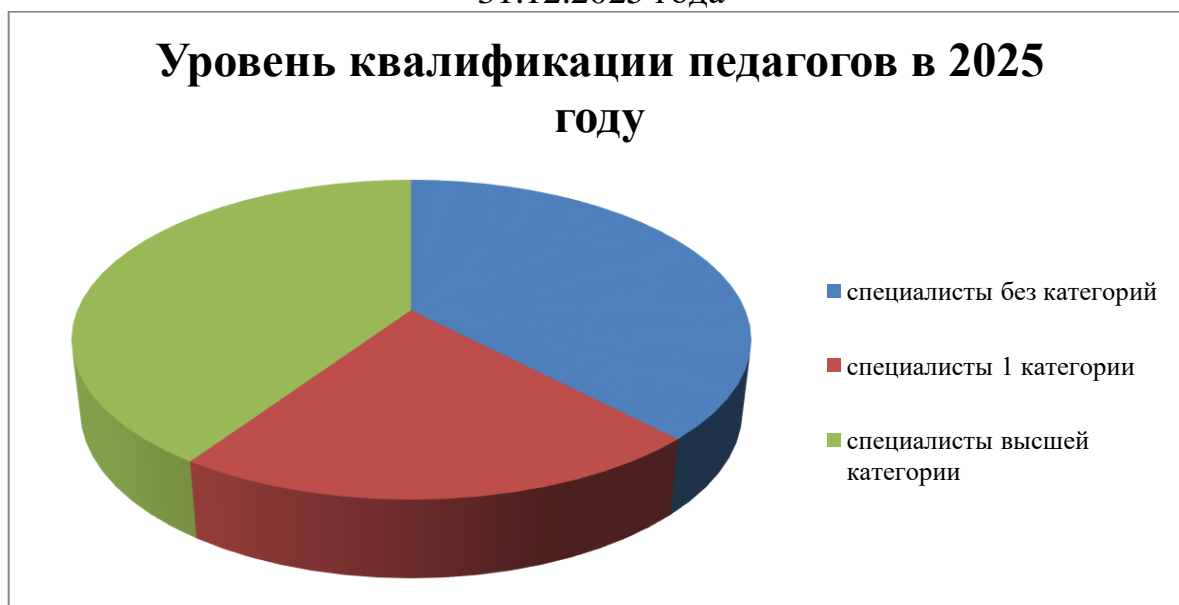
Диаграмма 1. Соотношение уровня квалификации педагогических кадров на 31.12.2025 года

В целях повышения качества образовательной деятельности в Школе проводится целенаправленная кадровая политика, основная цель которой — обеспечение оптимального баланса процессов обновления и сохранения численного и качественного состава кадров в его развитии, в соответствии потребностями Школы и требованиями действующего законодательства.